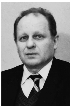
Я. П. Страдынь, главный редактор журнала в 1975–1985 гг.